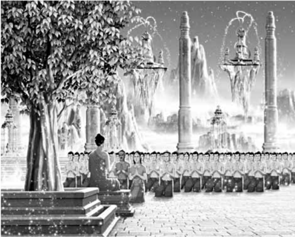
ณ สวรรค์ชั้นดาวดึงส์

“...เมื่อฉันตั้งหลายยังบังเกิดอยู่ การสมมติว่าสัตว์ก็ยังคงมีอยู่ ความจริงแล้วกองสังขารเหล่านี้ย่อมไม่ได้นามว่าสัตว์ มีแต่ทุกข์ เท่านั้นที่เกิดขึ้น มีแต่ทุกข์เท่านั้นที่ตั้งอยู่ และมีแต่ทุกข์เท่านั้นที่เสื่อมสิ้นไป นอกจากทุกข์ไม่มีอะไรเกิด นอกจากทุกข์ไม่มีอะไรดับ”