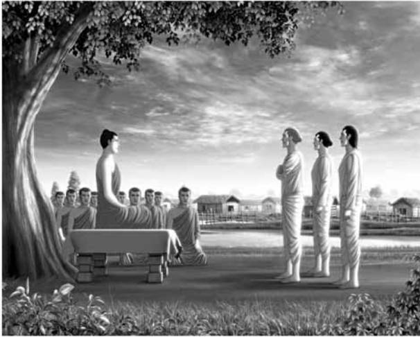
ณ กรุงเวรัญชรา

“...ท่านพรหมณ์ การส่งจิตออกไปภายนอกเพ่งโทษผู้อื่นนั้น คือเหตุ และมีทุกข์เป็นผล การพิจารณาตนเองคือ จิตตุดิตของตน เป็นมรรค มีนิโรธคือการดับทุกข์เป็นผล”