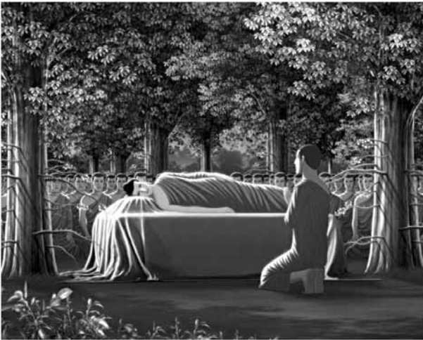
ณ สาละโนทยาน (ป่าสาละ) ของมัลลกะษัตริย์ กรุงกุสินารา แคว้นมัลละ

“อานนท์ สังฆเวชนียสถาน สถานที่อันเป็นเขตให้ระลึกถึงเรา มีอยู่ ๔ แห่ง ๑. อุทยานลุมพินี สถานที่ที่เราประสูติ ๒. พุทธคยา ในแคว้นมคธ สถานที่ที่เราตรัสรู้ ๓. ป่าอสิปตนมฤคทายวัน สถานที่ที่เราแสดงปฐมเทศนา ๔. สาละโนทยาน เมืองกุสินารา นี้ สถานที่ที่เราปรินิพพาน”